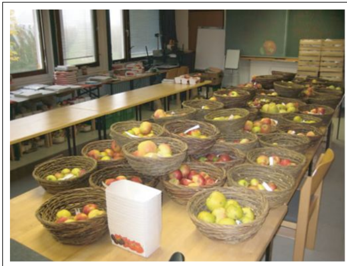
Abb. 1. Pomologische Bestimmung der Apfelsorten. Die pomologische Bestimmung der in der DGO zu erhaltenden Apfelsorten wird vom KOB Bavendorf in Zusammenarbeit mit dem Pomologen-Verein e. V. durchgeführt.

Im Oktober 2009 wurde das Apfelnetzwerk der DGO gegründet. Dieses Netzwerk ist mit sechs „Sammlungshaltenden Partnern“ und bislang 950 als „erhaltenswert“ eingestuften Apfelsorten das größte der DGO. Einer der „Sammlungshaltenden Partner“ ist die Stiftung Kompetenzzentrum Obstbau – Bodensee (KOB), die gleichzeitig auch die pomologische Bestimmung der zu erhaltenden Apfelsorten durchführt (Abb. 1). Das KOB liegt im südlichsten Obstanbaugebiet Deutschlands, der Obstregion Bodensee. Ihre Versuchsfelder und Einrichtungen befinden sich auf einem knapp 30 ha großen Areal in der Nähe von Ravensburg (Abb. 2). Ziele dieser Einrichtung sind die Förderung des Obstanbaus in der Bodenseeregion und damit der Erhalt der dort gewachsenen Kulturlandschaft. Dabei werden Aufgaben an der Nahtstelle zwischen Wissenschaft und Praxis übernommen. Hierzu zählt einerseits die an den Standort gebundene, grundlagenorientierte Forschung. Andererseits soll durch anwendungsorientierte Untersuchungen und Beratung, aber auch durch grenzüberschreitende Zusammenarbeit mit Einrichtungen anderer Obstbauregionen die Umsetzung der Forschungsergebnisse in die obstbauliche Praxis gefördert werden.