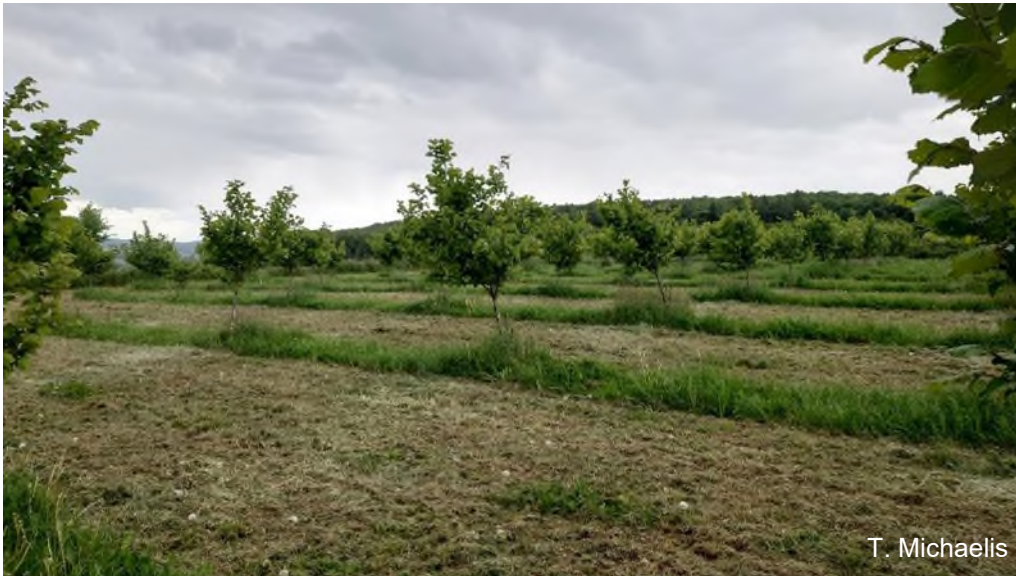
Dauerkultur / Streuobstwiese