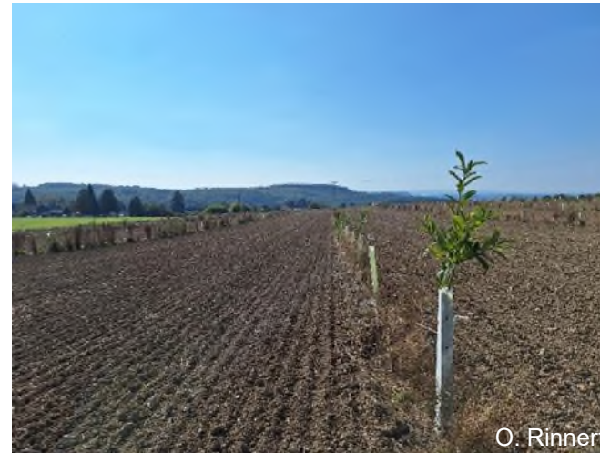
AFS nach GAP